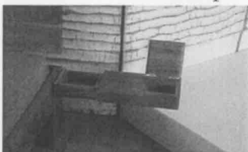
Detail vom Anbau einer Ablagen mit Schublade u. Klappe an dem Bett.

Bei der Gesellenfreisprechung am 27. Juli